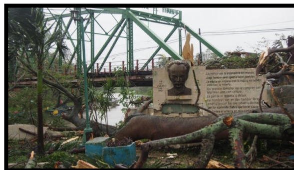
Monumento a José Martí en Sagua la Grande. (M. G. Vivero)

El 8 de septiembre, el Huracán Irma tocó tierra en Cuba, dejando estragos humanos y materiales en 13 de las 15 provincias de Cuba. El paso de Irma aumentó el número de viviendas y edificios derrumbados.